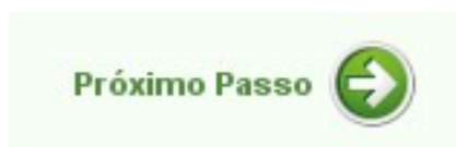
Desenho 5: Link para avançar as etapas do processo

Nesta nova tela, verifique atentamente os dados pessoais disponibilizados e altere o que estiver incorreto. Siga para o próximo passo acionando o link “ próximo passo ” localizado no canto inferior direito da tela.