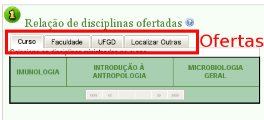
Desenho 6: Aba com as disciplinas divididas por oferta

Clique sobre a disciplina de sua preferência.