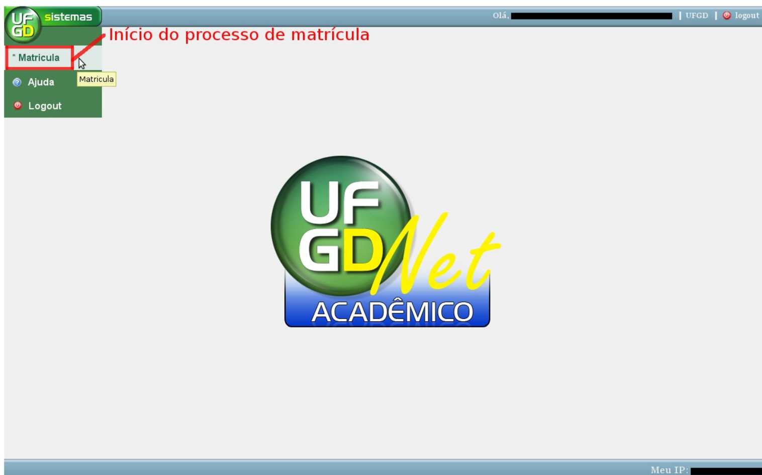
Desenho 3: Ambiente UFGDNet Acadêmico

De posse dessa nova senha, dirija-se novamente a tela inicial do sistema ( http://ciclopes.ufgd.edu.br:8080/UFGDNetAc ) e informe seus dados de login. Clicando em “ok” você acessará a tela inicial do ambiente “UFGDNet Acadêmico”.